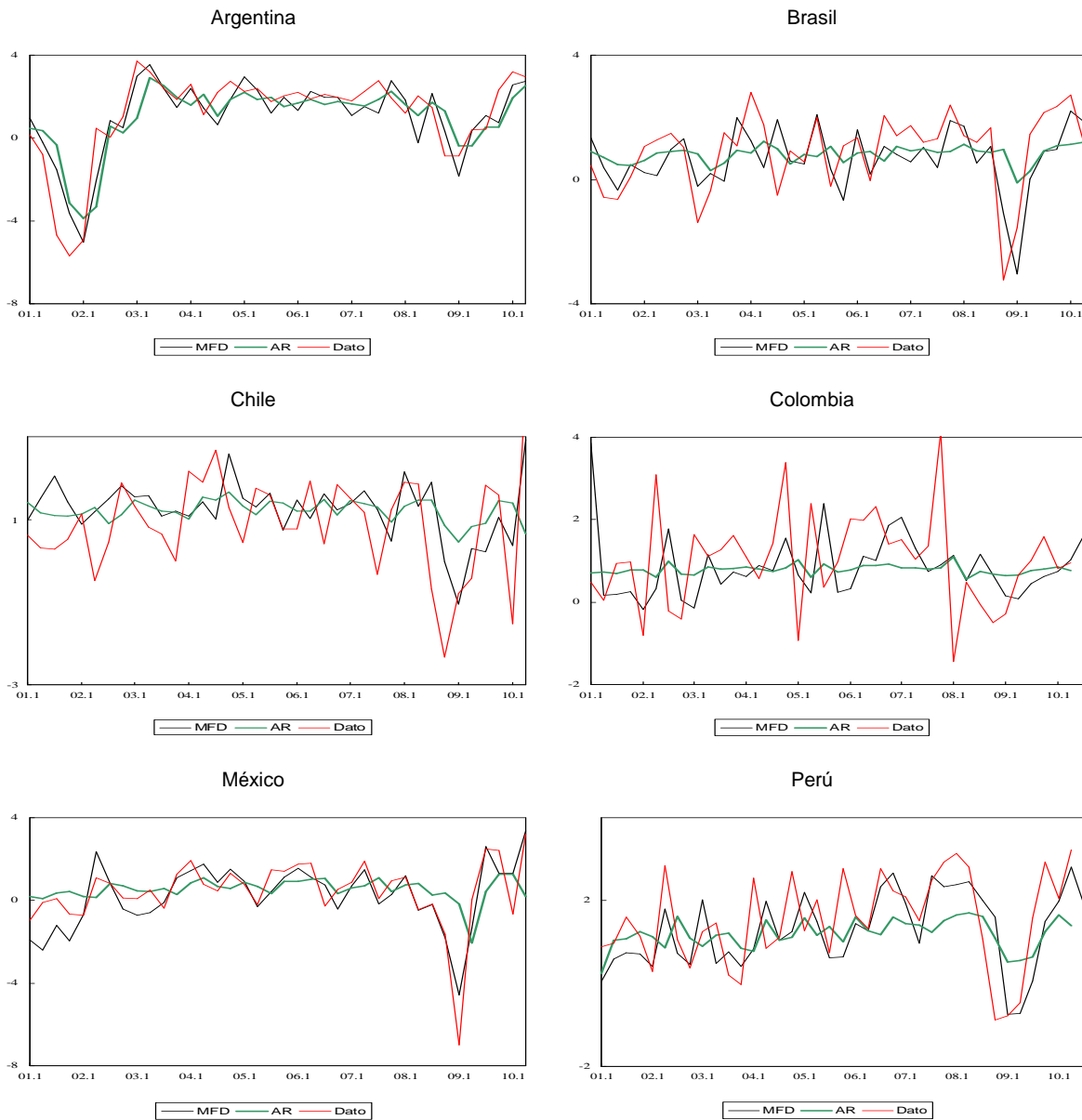
GRÁFICO 3 AMÉRICA LATINA (PAÍSES SELECCIONADOS): TASA DE VARIACIÓN TRIMESTRAL DE LAS PROYECCIONES REALIZADAS CON EL MODELO FACTORIAL DINÁMICO (MFD) Y UN MODELO AUTORREGRESIVO TRADICIONAL (AR) a